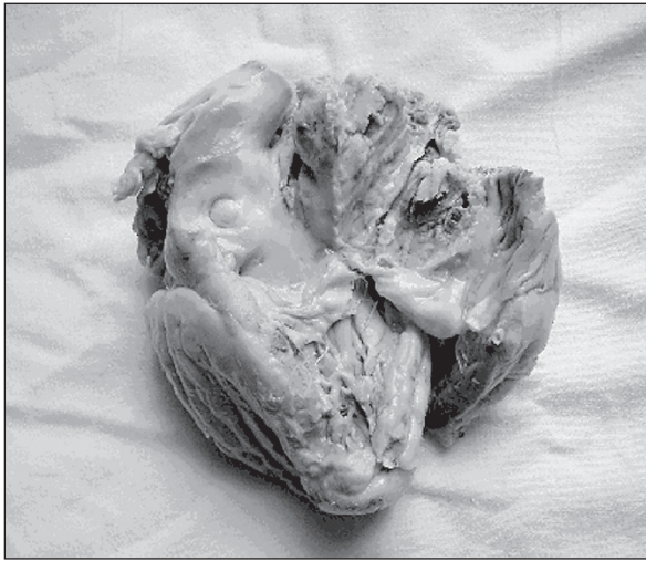
Рис. 1. Опухоль правого предсердия

плотными узелками размером от 3 мм до 1 см. На разрезе эти образования были представлены темно-коричневой тканью с очагами беловатого цвета. В просвете ветвей легочной артерии определялась жидкая кровь.